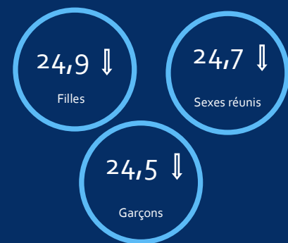
Élèves du secondaire consommant en général le nombre minimal 1 de portions de légumes et de fruits recommandé quotidiennement par l'ancien GAC selon le sexe, Lanaudière, 2016-2017 (%)

La proportion d'élèves consommant chaque jour des légumes et des fruits en suffisance est passée d'un peu moins du tiers (31 %) en 2010-2011 au quart (25 %) dans cette situation en 2016-2017. Aucune différence ne départage les garçons et les filles. Il en va de même pour les pourcentages lanaudois similaires à ceux du reste du Québec.