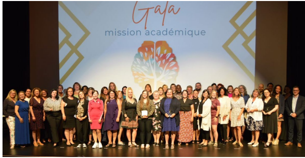
Félicitations aux lauréats et aux intervenants en nomination lors du Gala mission académique!